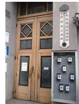
[みゅう]ウィーン入口