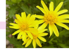
marguerite des savanes マルグリット