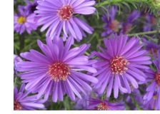
asters roses, violets et blancs シオン