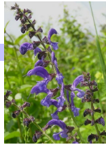
sauge rouge セージ