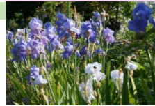
les fameuses allées d'iris アイリス/アヤメ