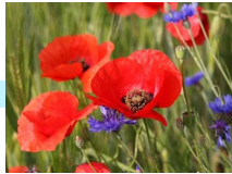
coquelicots ヒナゲシ/コクリコ