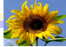
tithonias (tournesol du Mexique) ひまわり