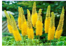
lis des steppes ユリ