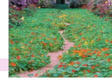
capucines de Lobb différentes variétés キンレンカ